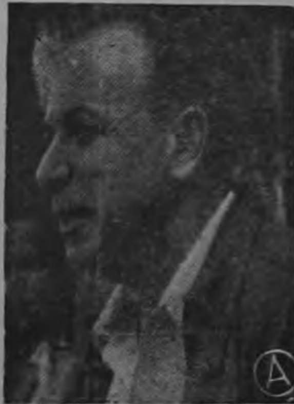
Don Francisco J. Orlich