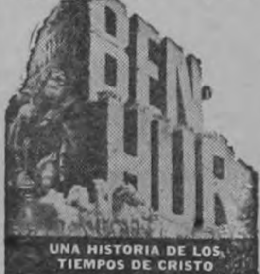
UNA HISTORIA DE LOS TIEMPOS DE CRISTO